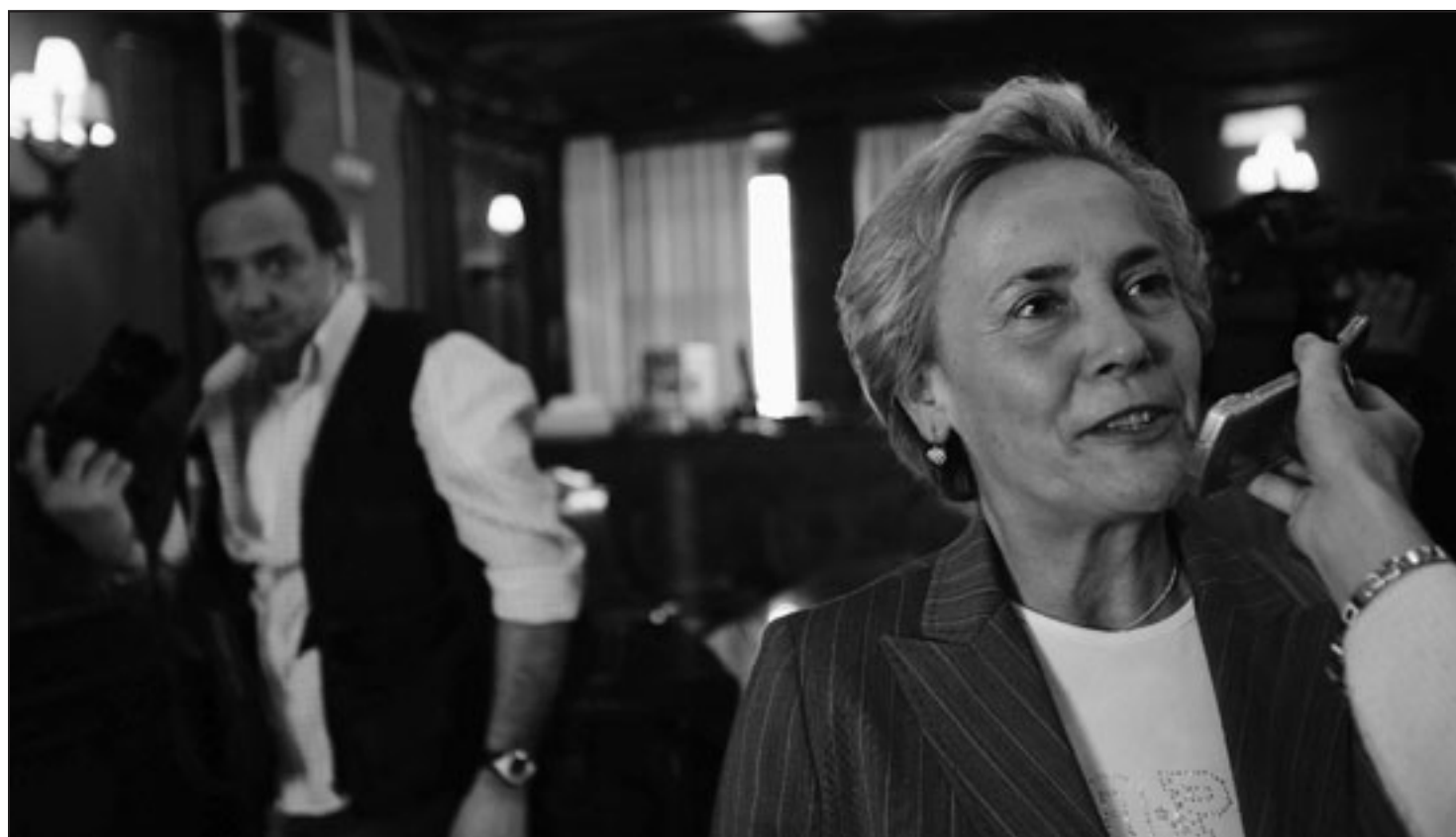
Maria Teresa Bassa Poropat al centro dell'attenzione nell'aula del consiglio comunale dopo che è stata annunciata la sua vittoria per la presidenza della Provincia. A destra l'esterno di palazzo Galatti. L'ente che è stato retto negli ultimi anni da una giunta di centrodestra ora passa a una coalizione di segno diverso al termine di una campagna elettorale dai toni pacati tra Scoccimarro e Bassa Poropat