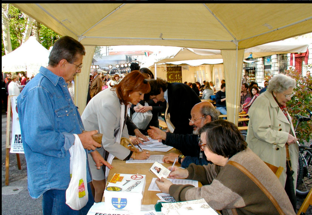
1° Maggio radicale (Gorizia 01/05/2004) - Referendum procreazione medicalmente assistita (PMA)