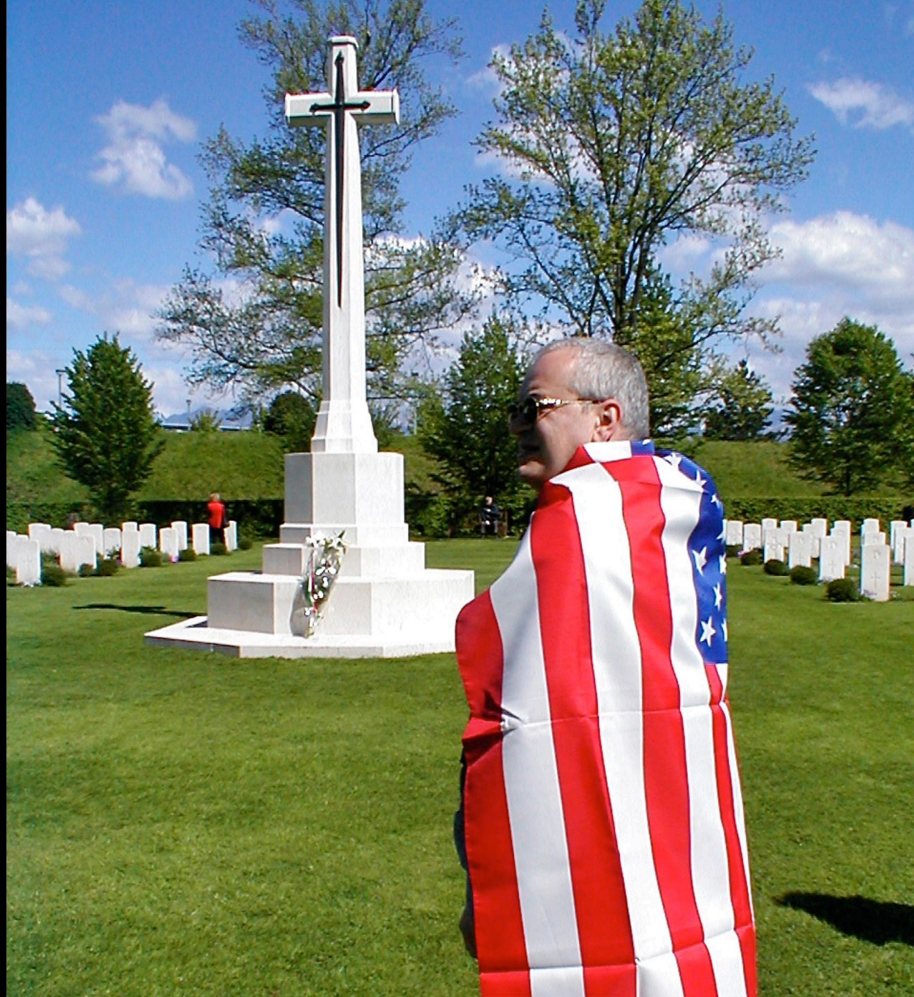
Cerimonia commemorativa dei soldati angloamericani caduti per la liberazione dell'Italia dal fascismo - Tavagnacco (UD) 25 Aprile 2004