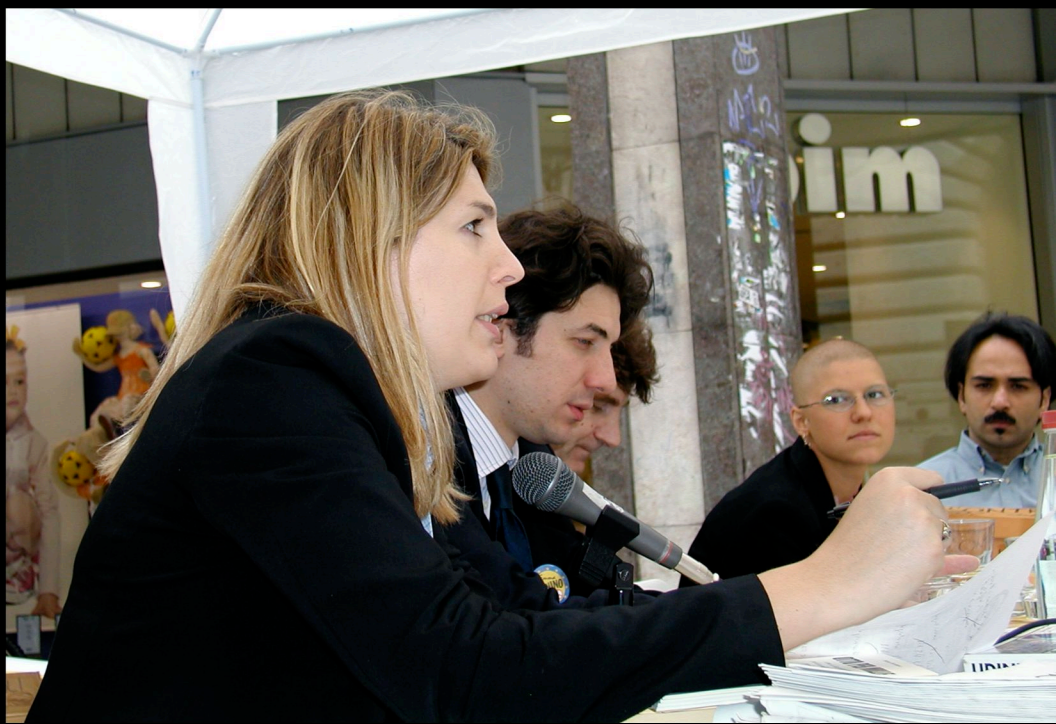
Conferenza stampa di presentazione dei candidati della Lista Bonino alle elezioni europee (Udine 05 giugno 2004)