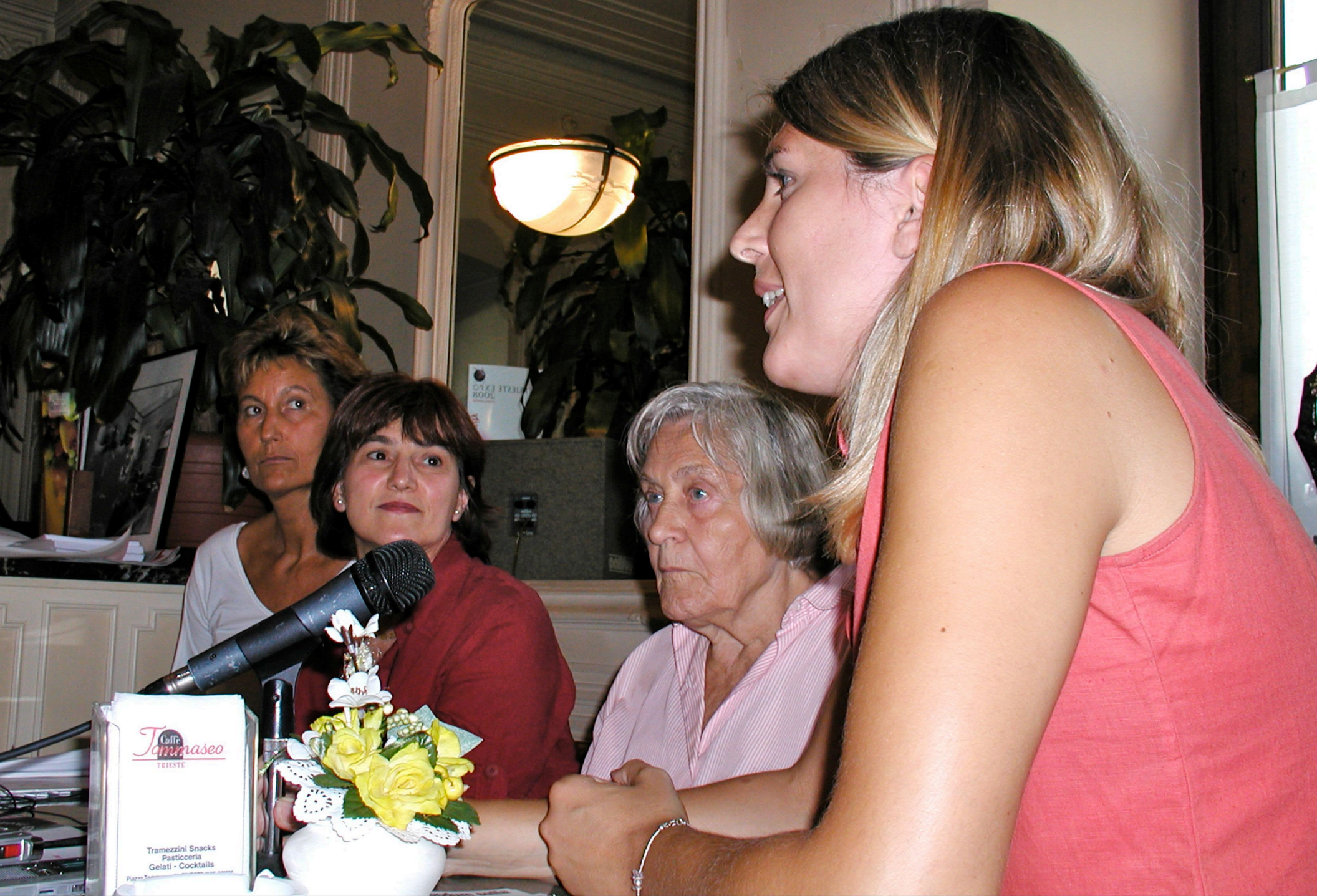
Margherita Hack testimonial del referendum sulla Procreazione Medicalmente Assistita (Trieste 24/08/2004)