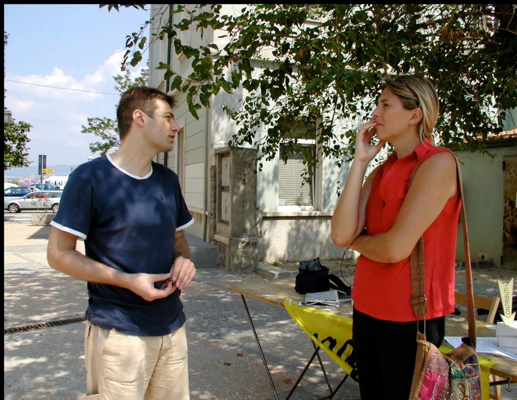
Referendum sulla procreazione medicalmente assistita - Tavoli di raccolta firme - Muggia (TS) 05/08/2004