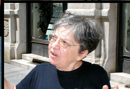
Referendum PMA (procreazione medicalmente assistita) - Tavolo di raccolta firme (Trieste 02 giugno 2004)