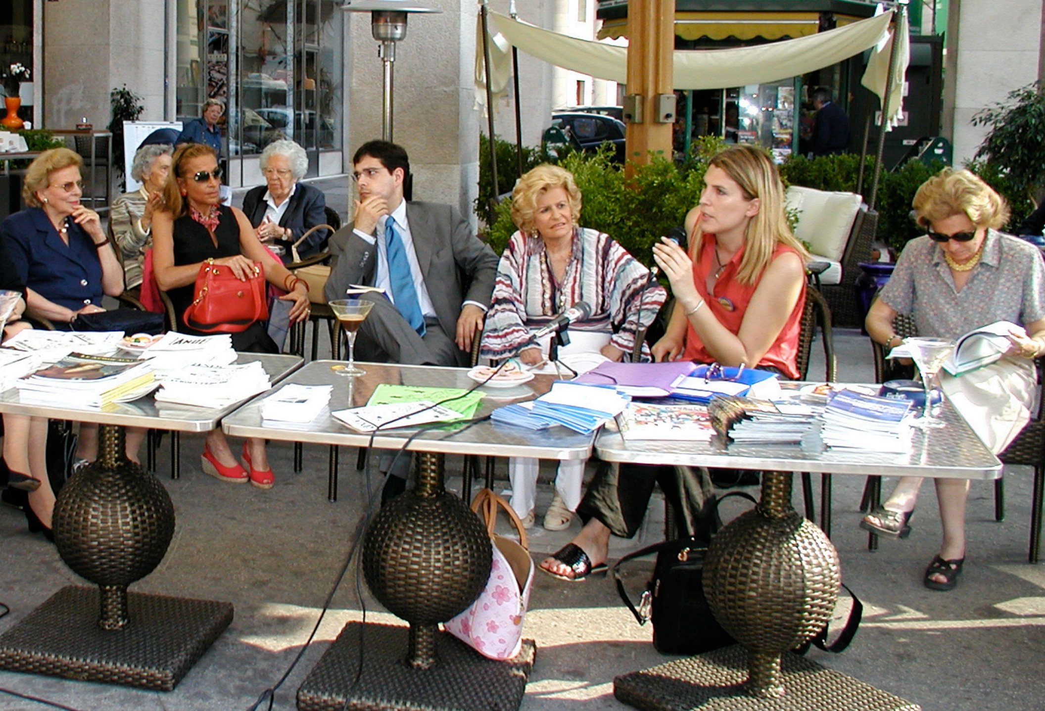
Incontro dell'A.N.D.E. (Associazione Nazionale Donne Elettrici) con i candidati radicali alle elezioni Europee con Daniele Capezzone (Trieste 10 giugno 2004)