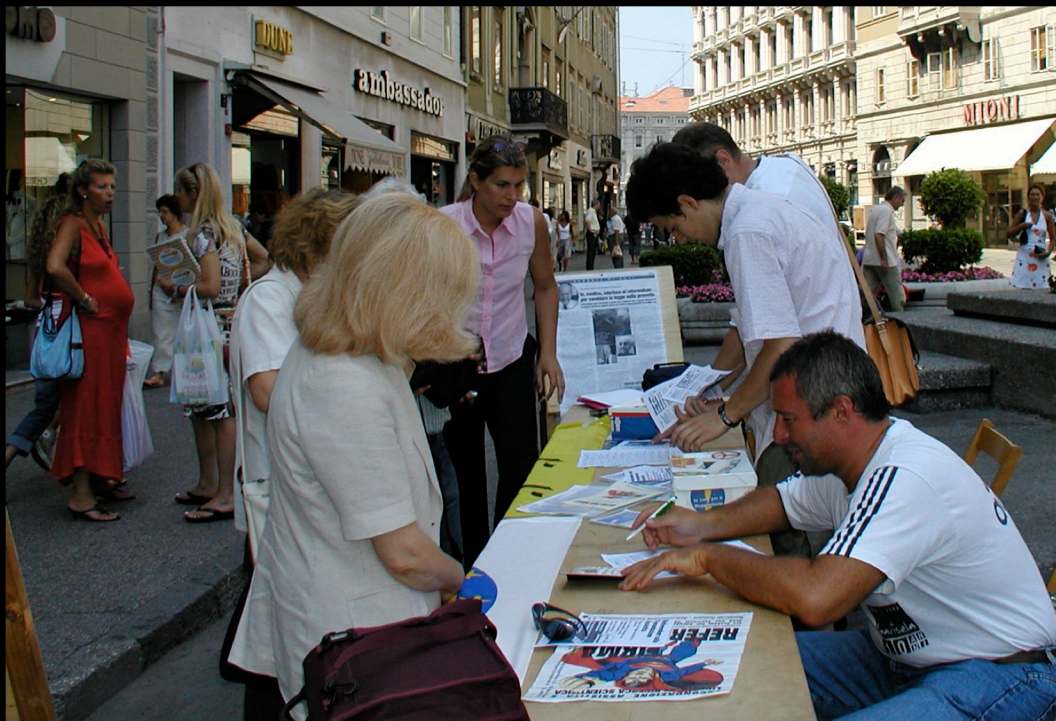
Procreazione medicalmente assistita - Conferenza stampa sui Referendum Day (Trieste 23 Luglio 2004)