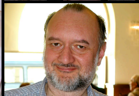
Assemblea dell'associazione radicale Riformatori Presidenzialisti (RRP) - Trieste 02 giugno 2004