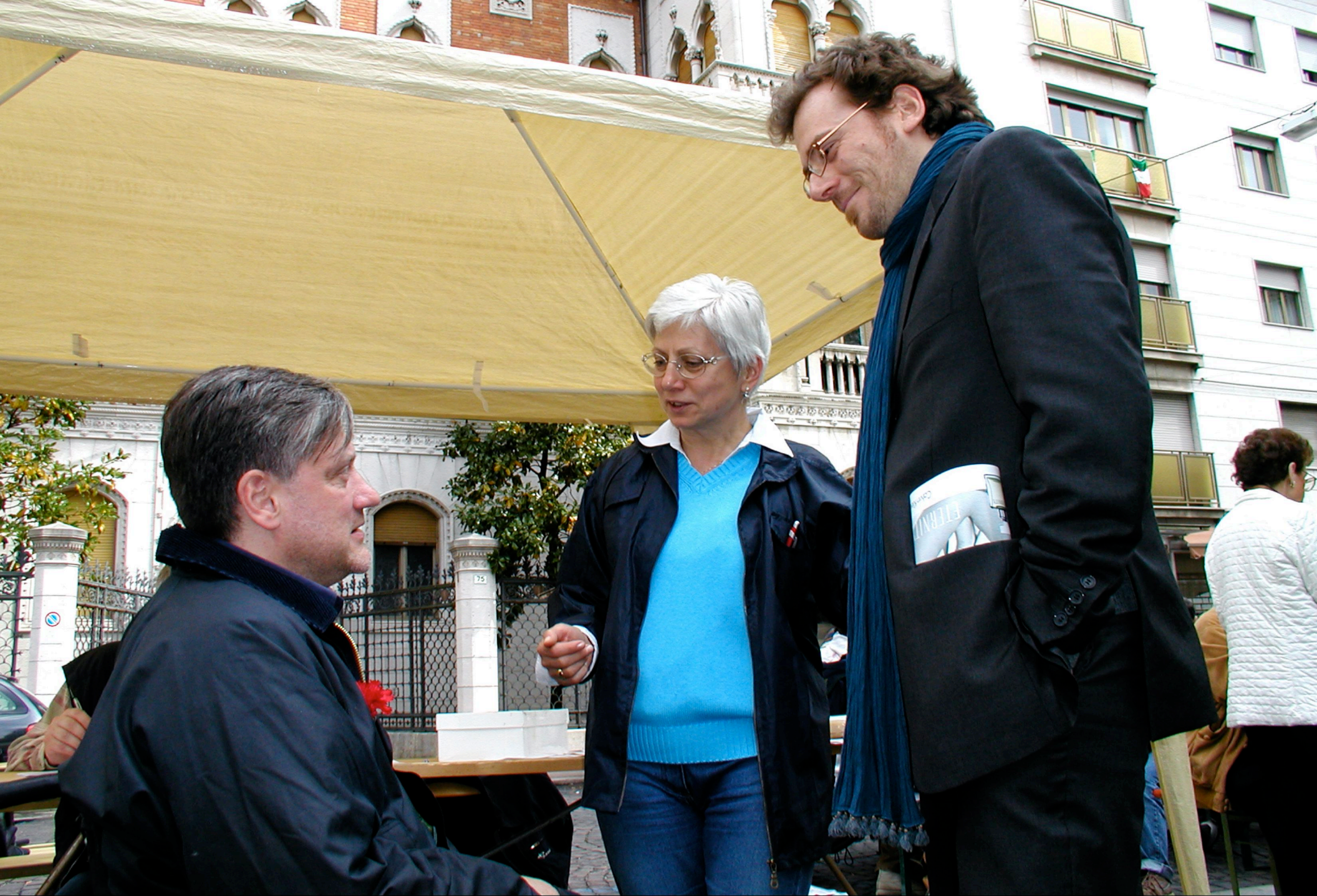
1° Maggio radicale (Gorizia 01/05/2004) - Referendum procreazione medicalmente assistita (PMA)