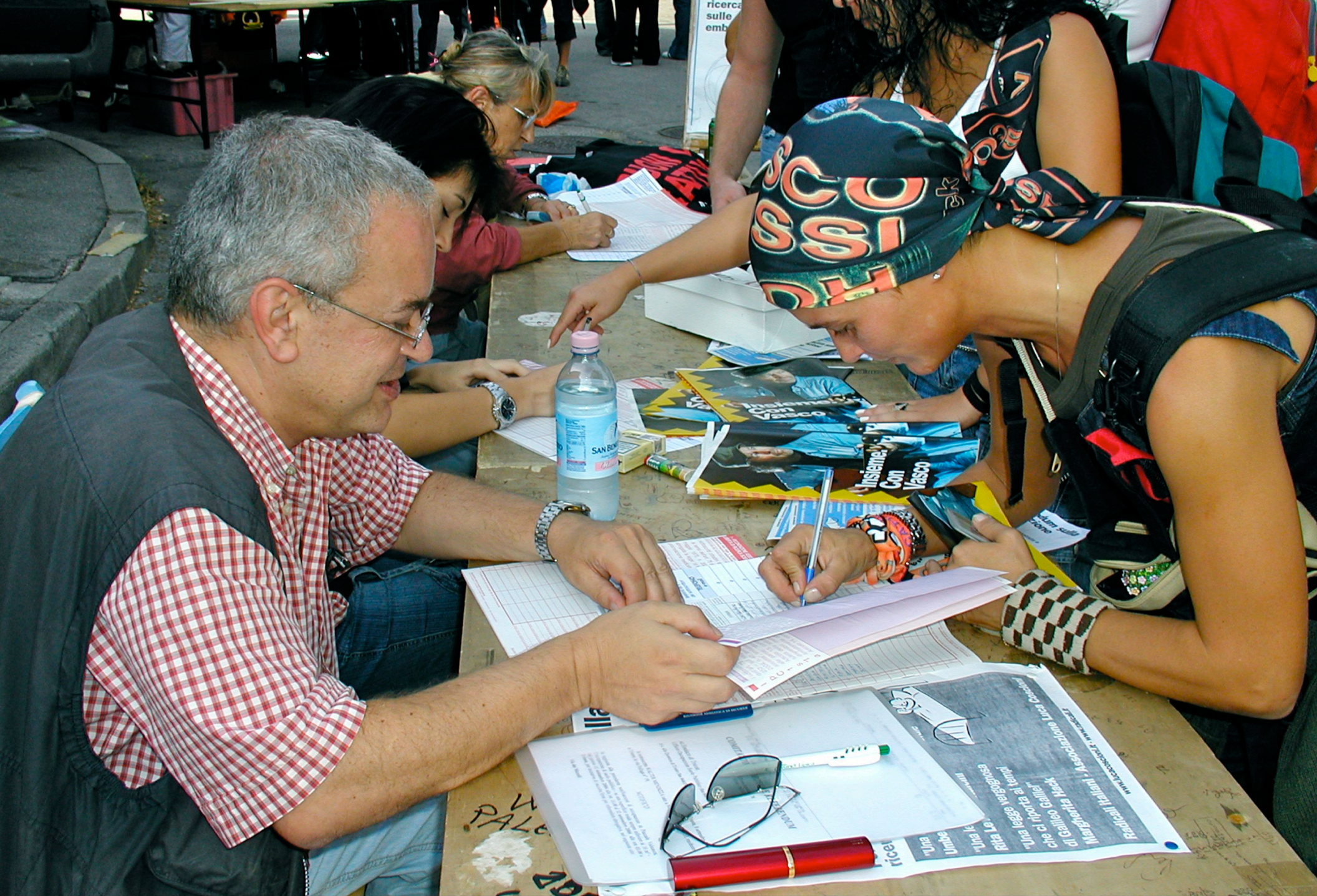
Referendum PMA: Concerto di Vasco Rossi (Trieste 11 settembre 2004)