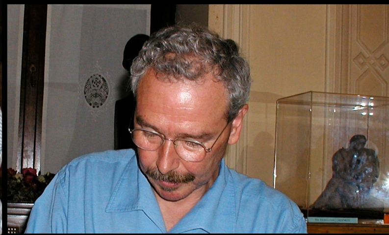
La strana coppia: Radicali e Rifondazione Comunista uniti per abolire la legge sulla procreazione medicalmente assistita (Trieste 25 giugno 2004)