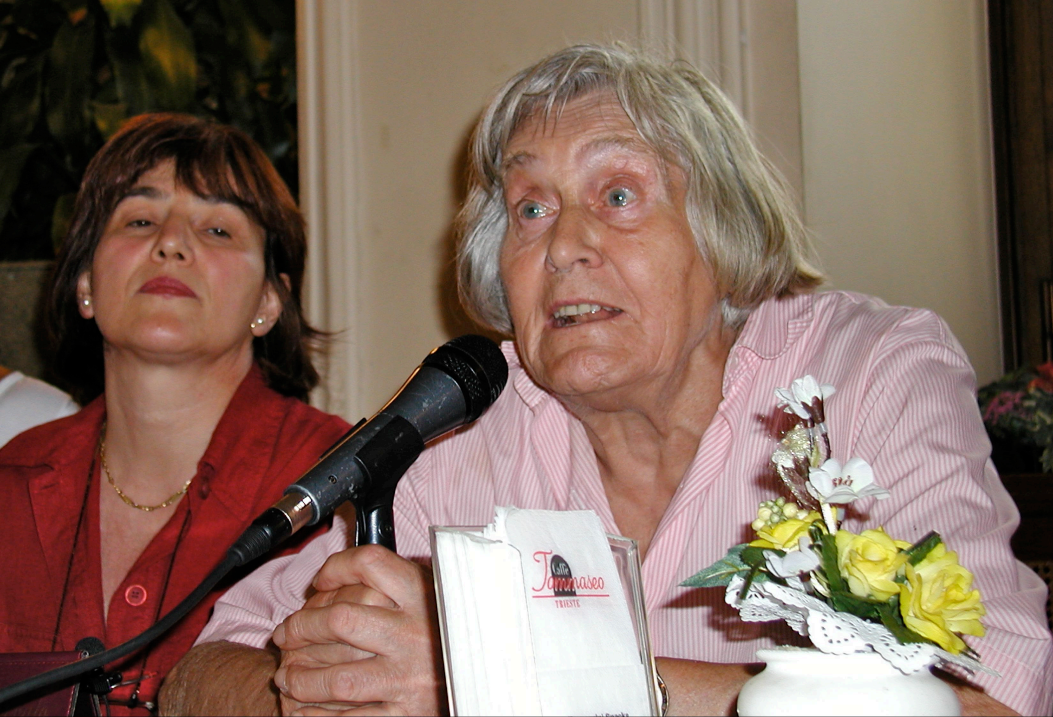
Margherita Hack testimonial del referendum sulla procreazione medicalmente assistita (Trieste 24/08/2004)