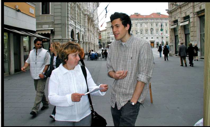
Referendum procreazione medicalmente assistita - Tavoli di raccolta firme (Trieste 24/04/2004)