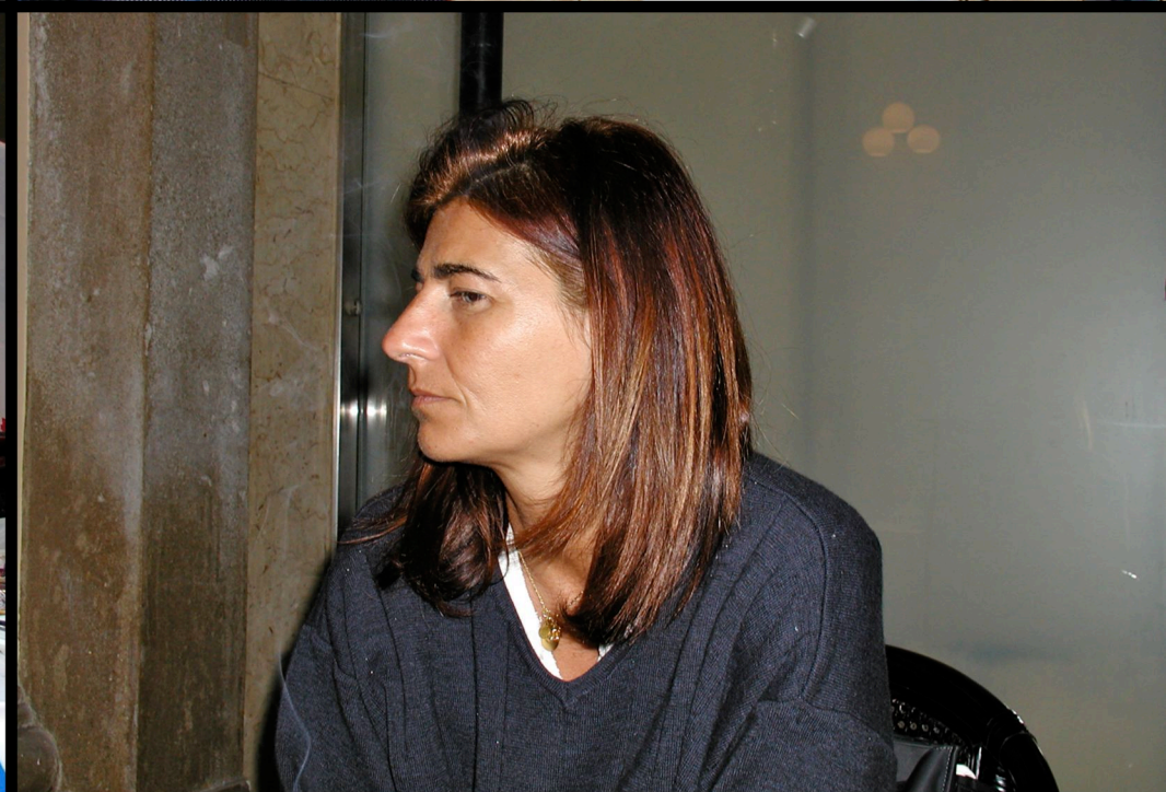
Referendum procreazione medicalmente assistita - Conferenza stampa di presentazione (Trieste 24/04/2004)