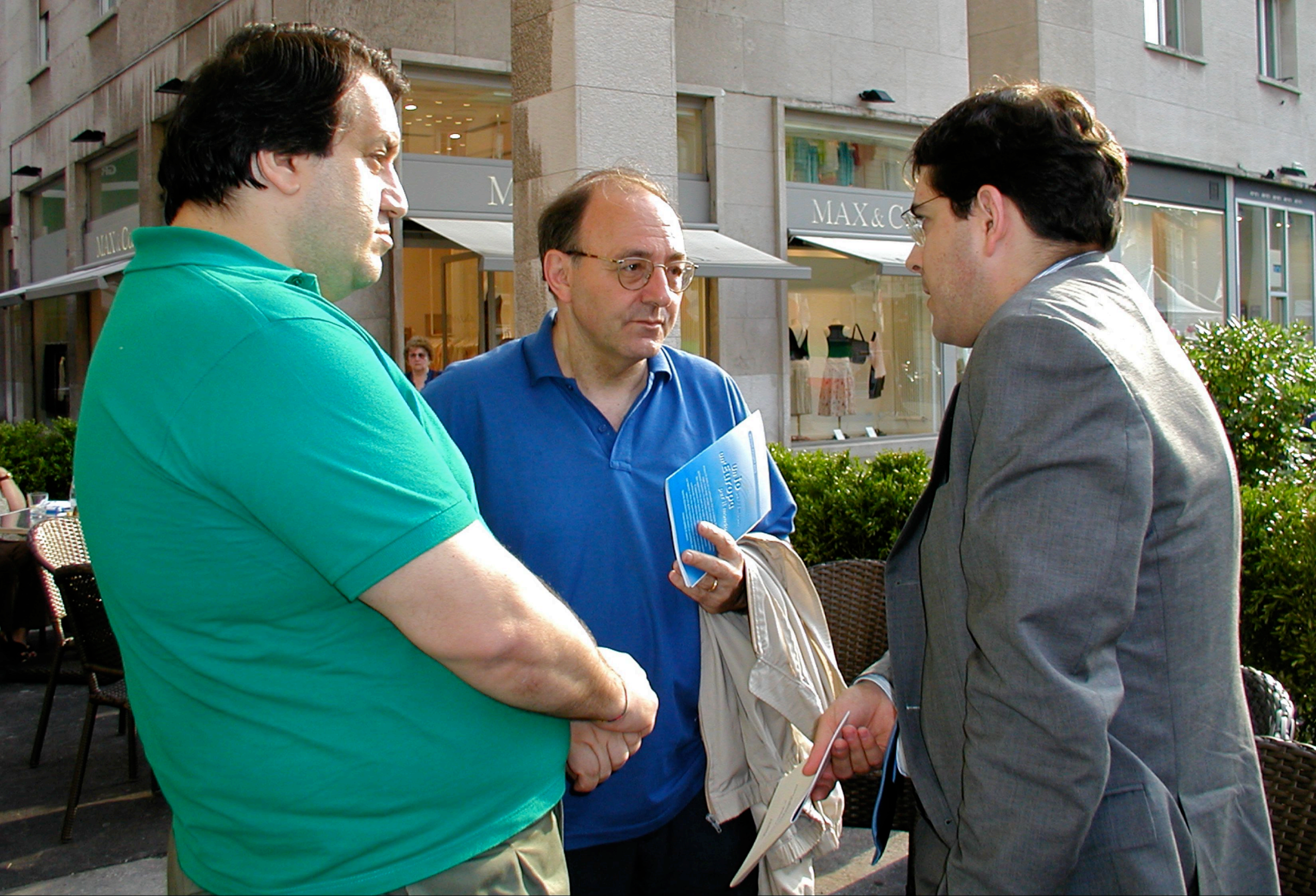
Incontro dell'A.N.D.E. (Associazione Nazionale Donne Elettrici) con i candidati radicali alle elezioni Europee con Daniele Capezzone (Trieste 10 giugno 2004)