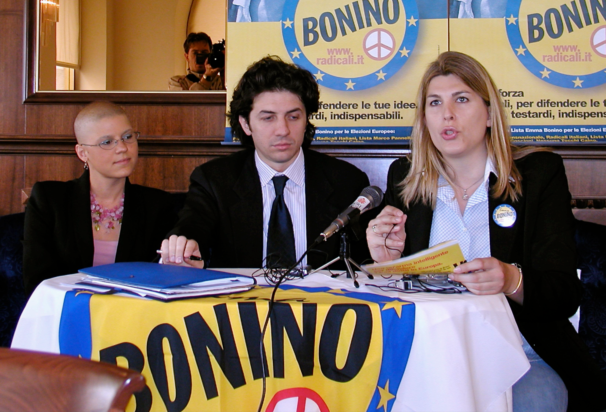
Conferenza stampa di presentazione dei candidati della Lista Bonino alle elezioni europee (Trieste 05 giugno 2004)