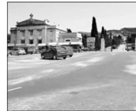
Il piazzale ristrutturato

CANTIERE DA 24MILA EURO Cimitero di Sant'Anna Ristrutturato il piazzale