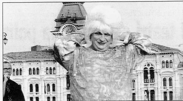
Platinette in piazza dell'Unità d'Italia in occasione di una sua precedente visita a Trieste.

Alle 11.30, conferenza stampa al Tommaseo su «Esuli. Le tante promesse del Centrodestra e la real-