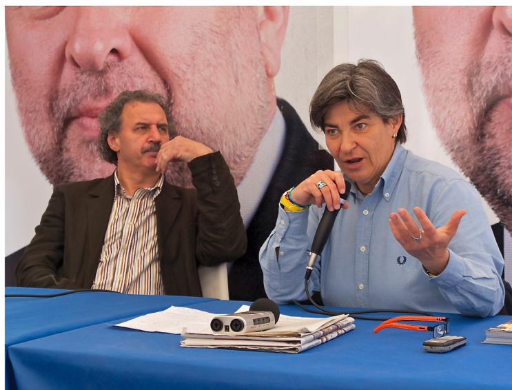
2011 - I Radicali del Friuli Venezia Giulia