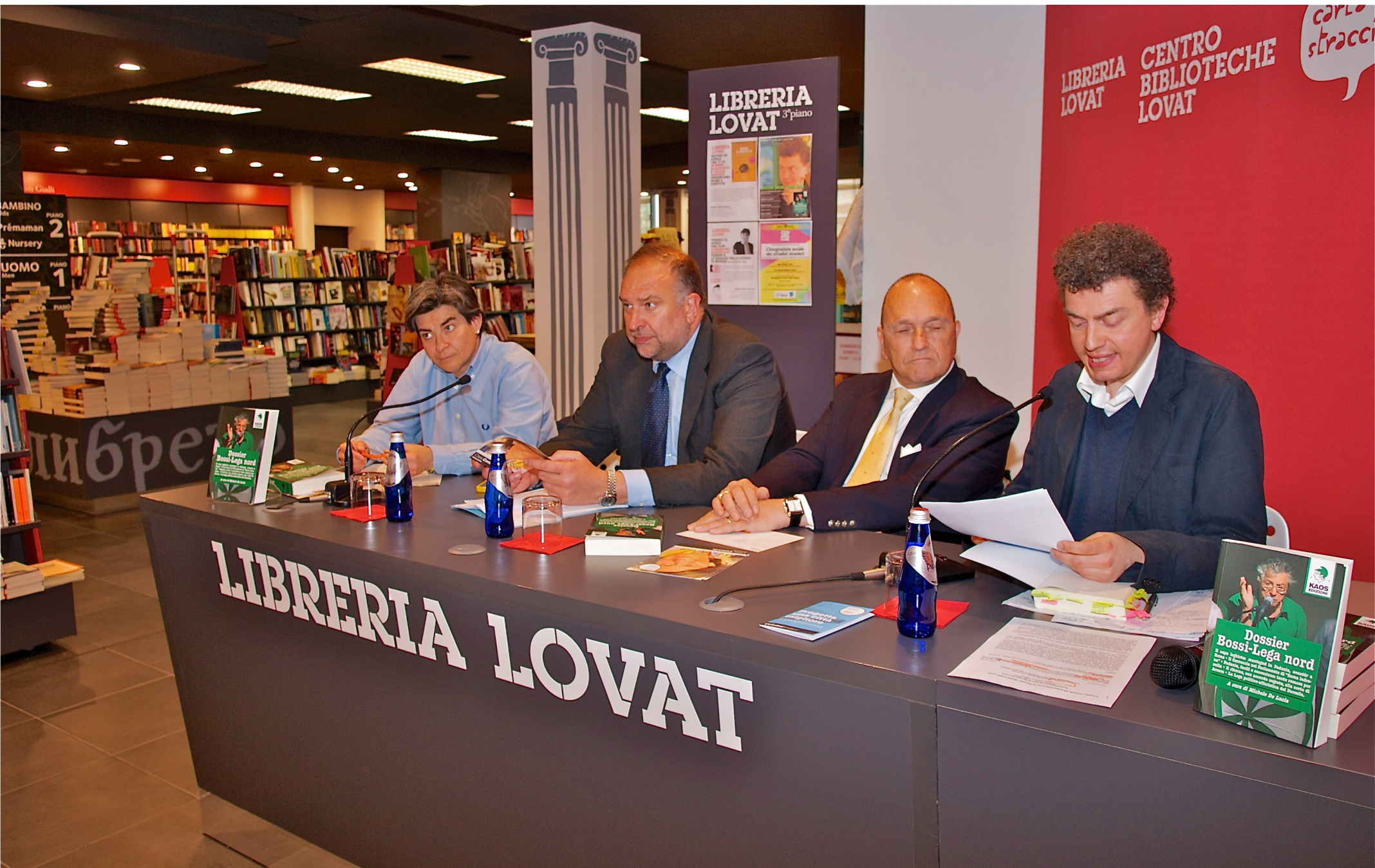
Presentazione del libro di Michele De Lucia "Dossier Bossi-Lega Nord" (Trieste 29/04/2011)