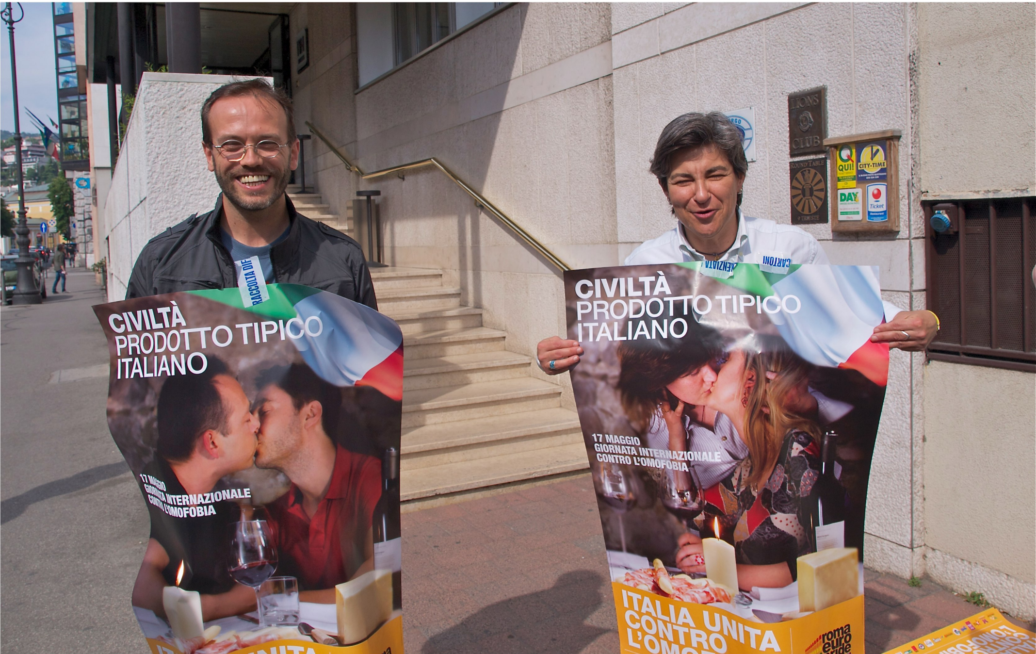
Tutti insieme con i manifesti dei baci gay davanti a Buttiglione - Manifestazione per i diritti di tutte le famiglie (Trieste 11/05/2011)