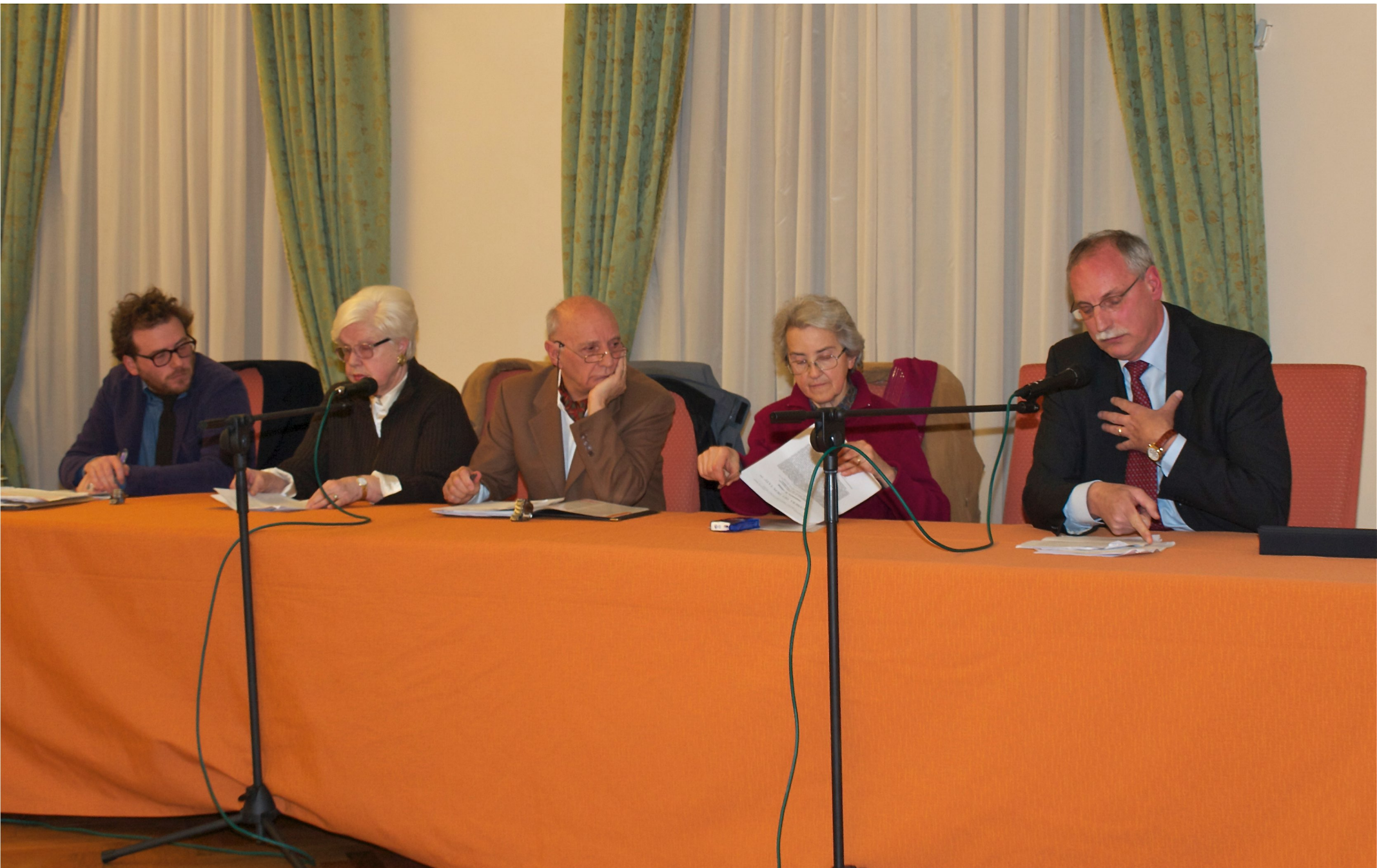
Dibattito: Le scelte di fine vita e il testamento biologico (Gorizia 14/01/2011)