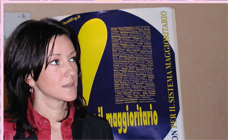
Convention "Io sono per il maggioritario" (Trieste 22 febbraio 2003). Il Friuli Venezia Giulia per un sistema elettorale maggioritario secco.