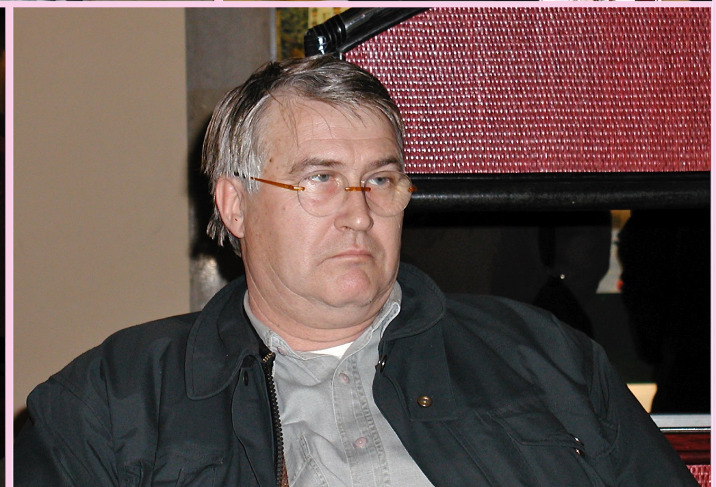
II° Congresso dell'associazione radicale "Riformatori Presidenzialisti" (Trieste 23/12/2003)