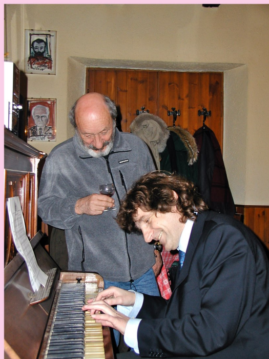
2003 - I Radicali del Friuli Venezia Giulia