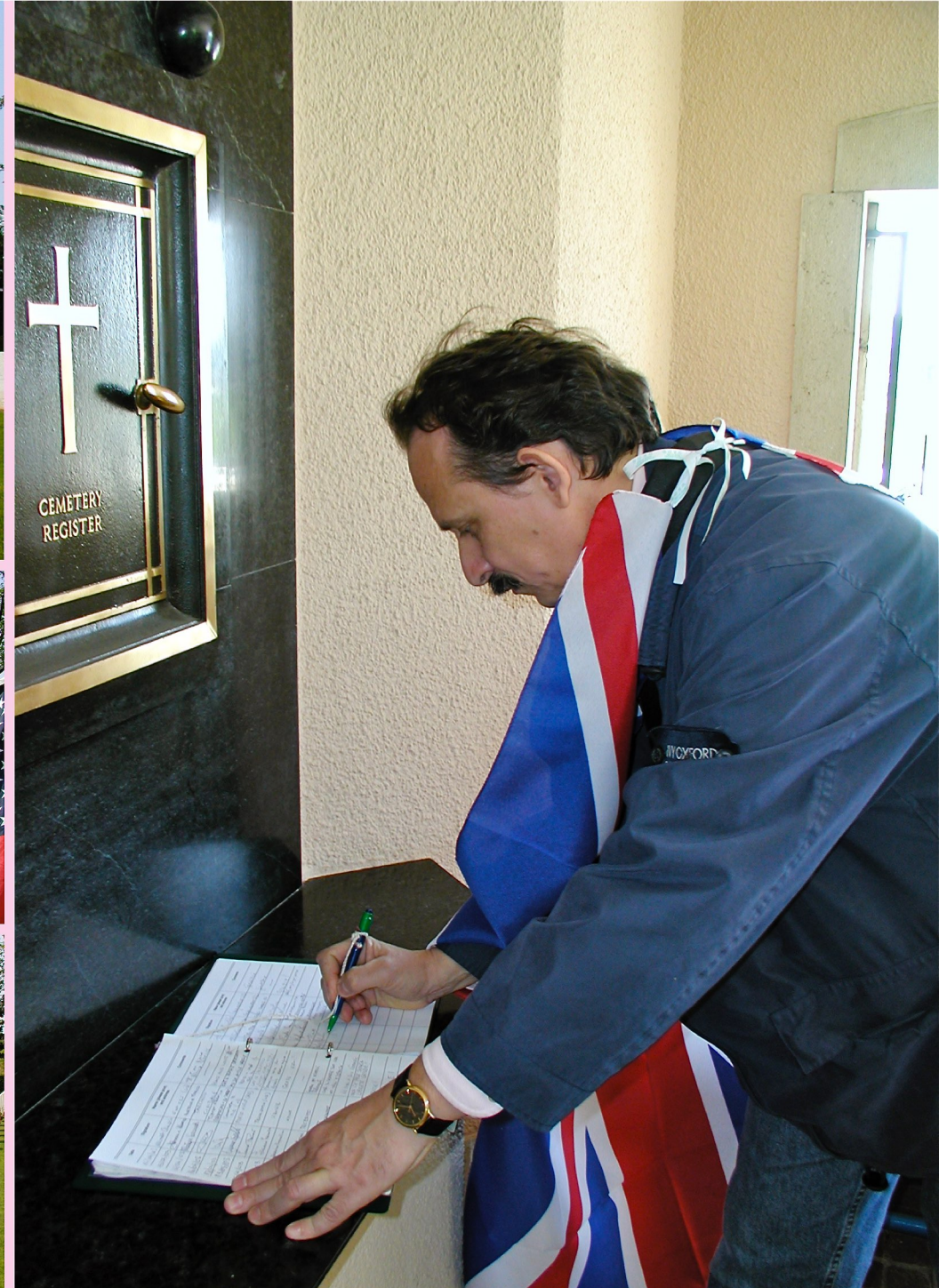
Cerimonia commemorativa dei soldati angloamericani caduti per la liberazione dell'Italia dal fascismo - Tavagnacco (UD) 25 Aprile 2003