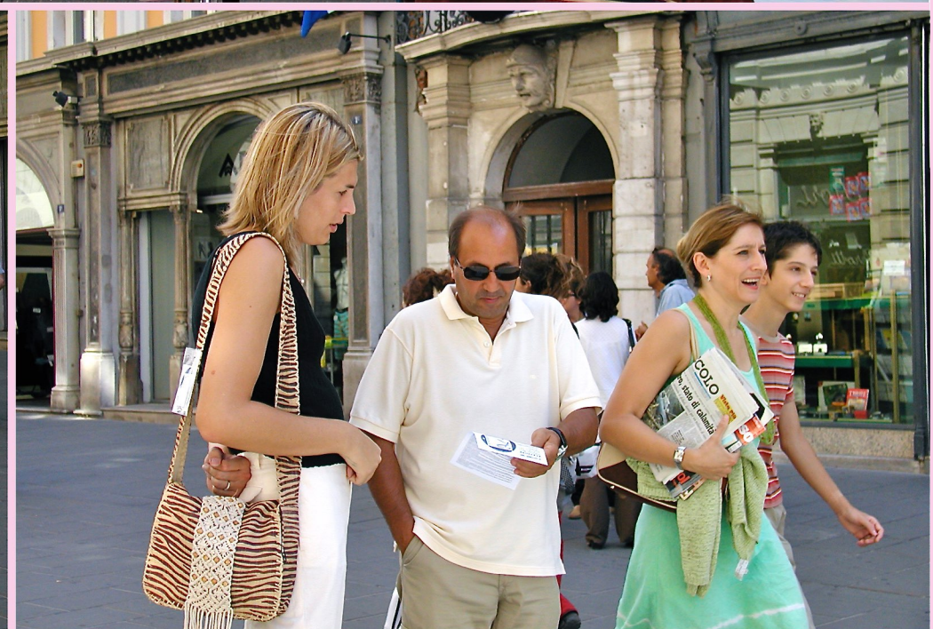
Tavoli di raccolta firme per le elezioni suppletive (Trieste settembre 2003)