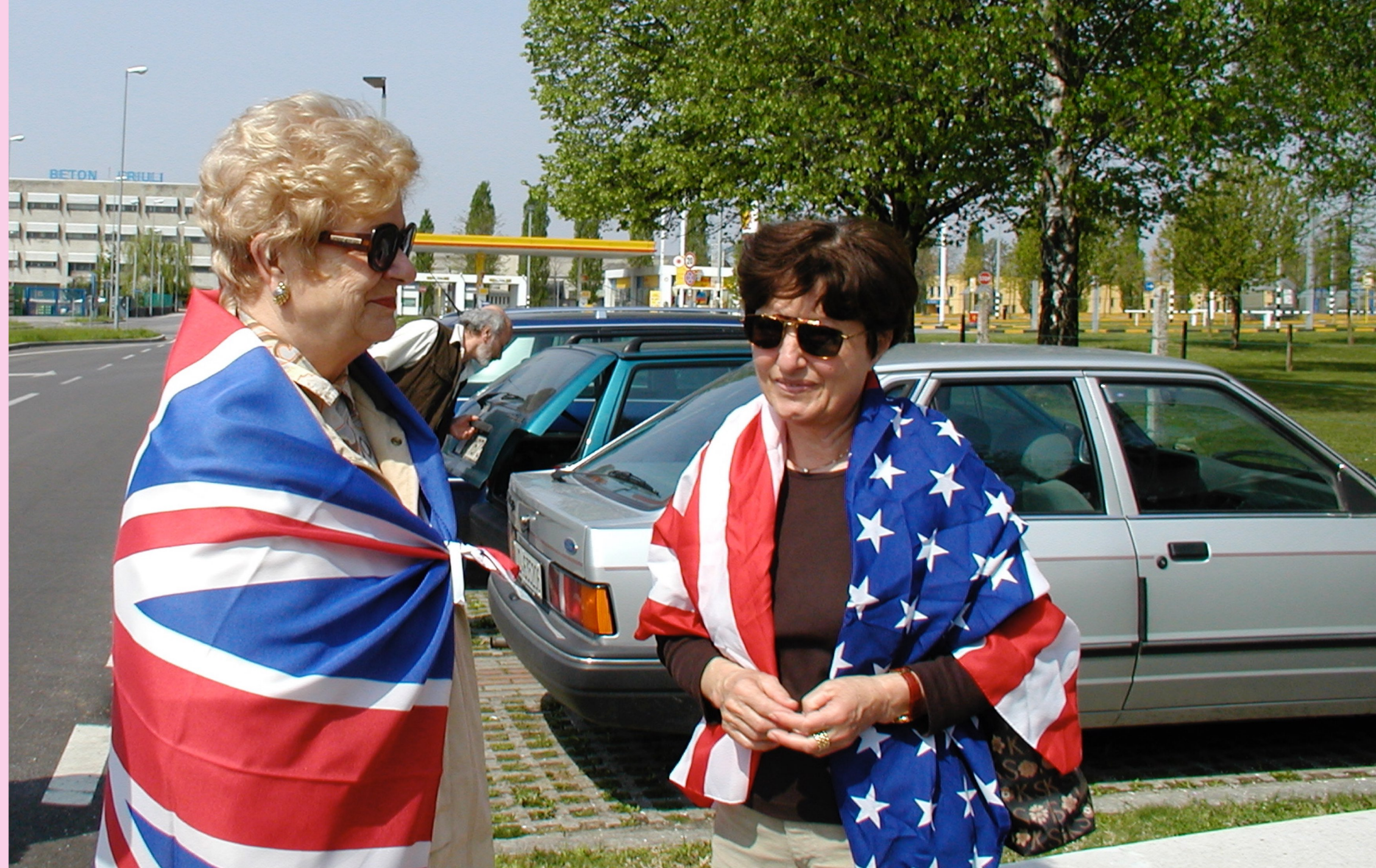
2003 - I Radicali del Friuli Venezia Giulia

A cura di Marco Gentili - www.radicalifvg.it