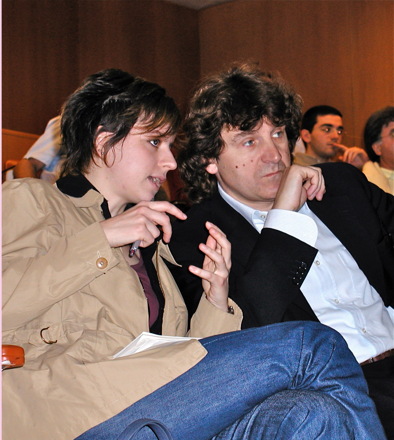
Convegno con Marco Cappato - Cellule staminali: quale futuro ? - Udine 17 maggio 2003