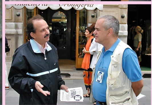
Tavoli di raccolta firme per le elezioni suppletive (Trieste settembre 2003)