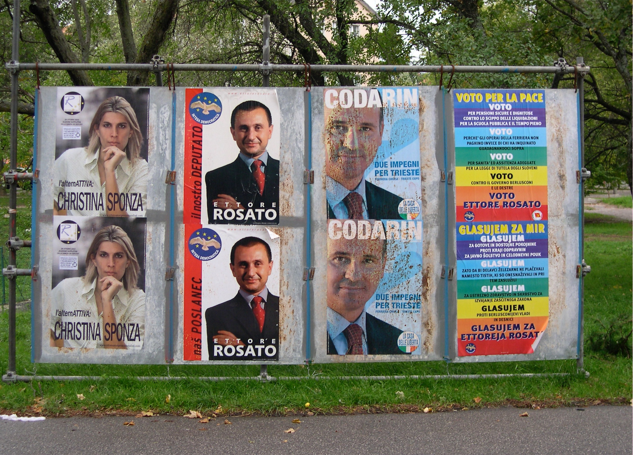
I manifesti elettorali (Trieste ottobre 2003)