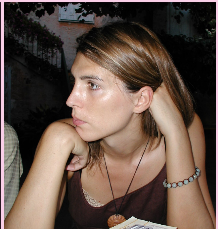
Gradisca d'Isonzo (Gorizia) 09/08/2003 - Assemblea sulle elezioni suppletive del 26 ottobre 2003