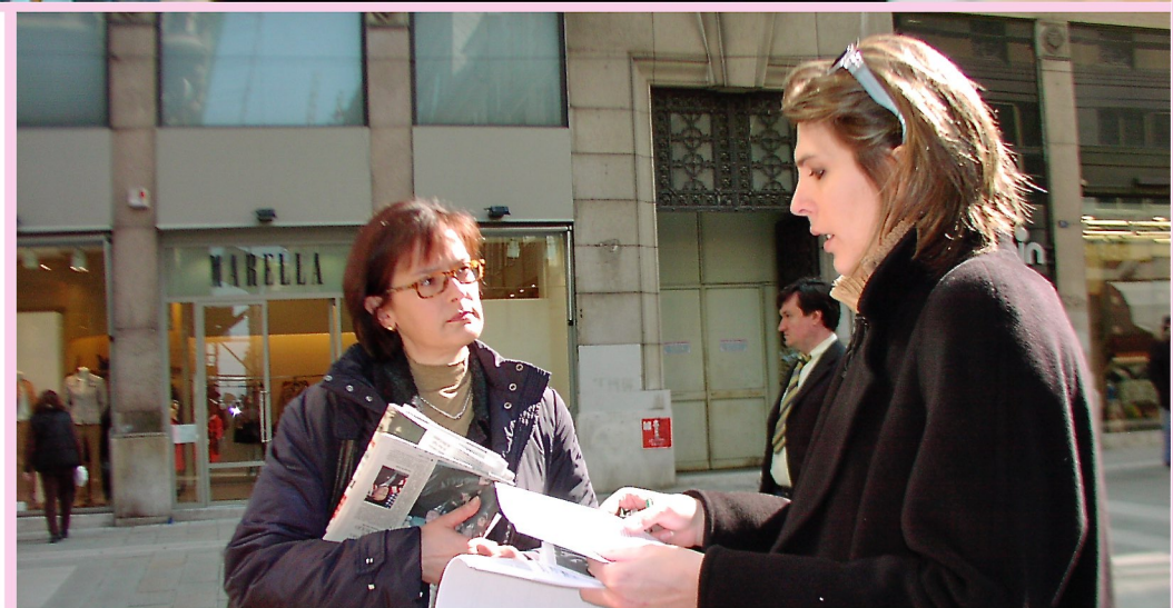
Trieste 8 Marzo 2003: STOP FGM (Mutilazioni Genitali Femminili) - Conferenza stampa al tavolo