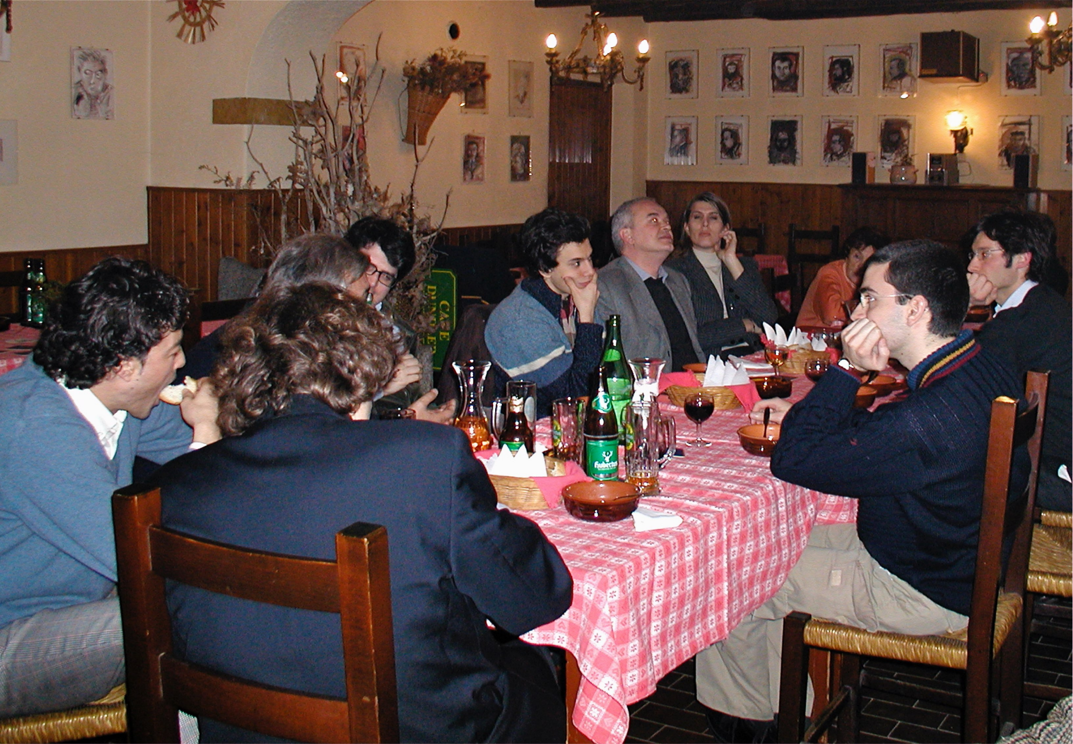
Gradisca d'Isonzo (GO) 30/01/2003 - Assemblea regionale dei radicali del FVG